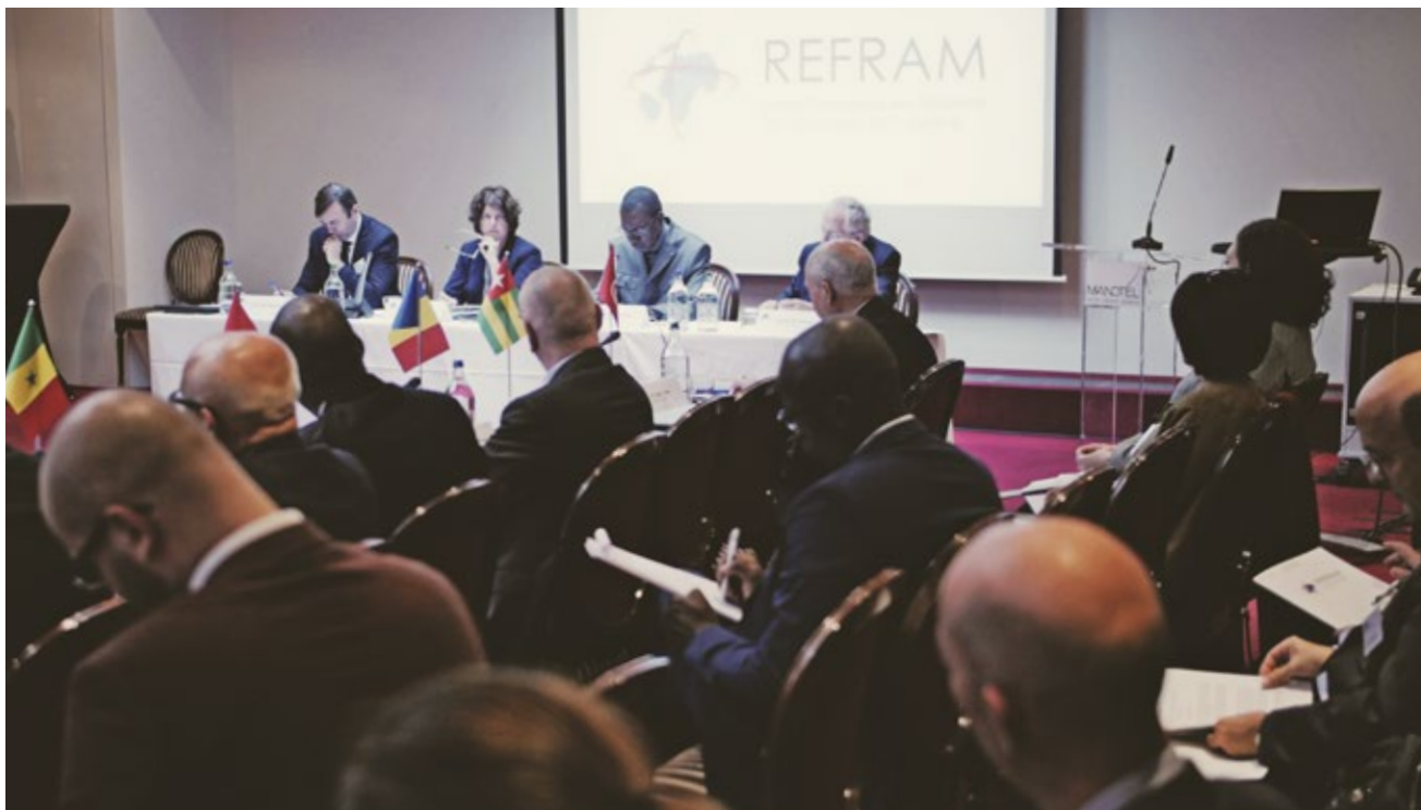
5 e Conférence des Présidents du REFRAM, 24 et 25 octobre 2017, Genève