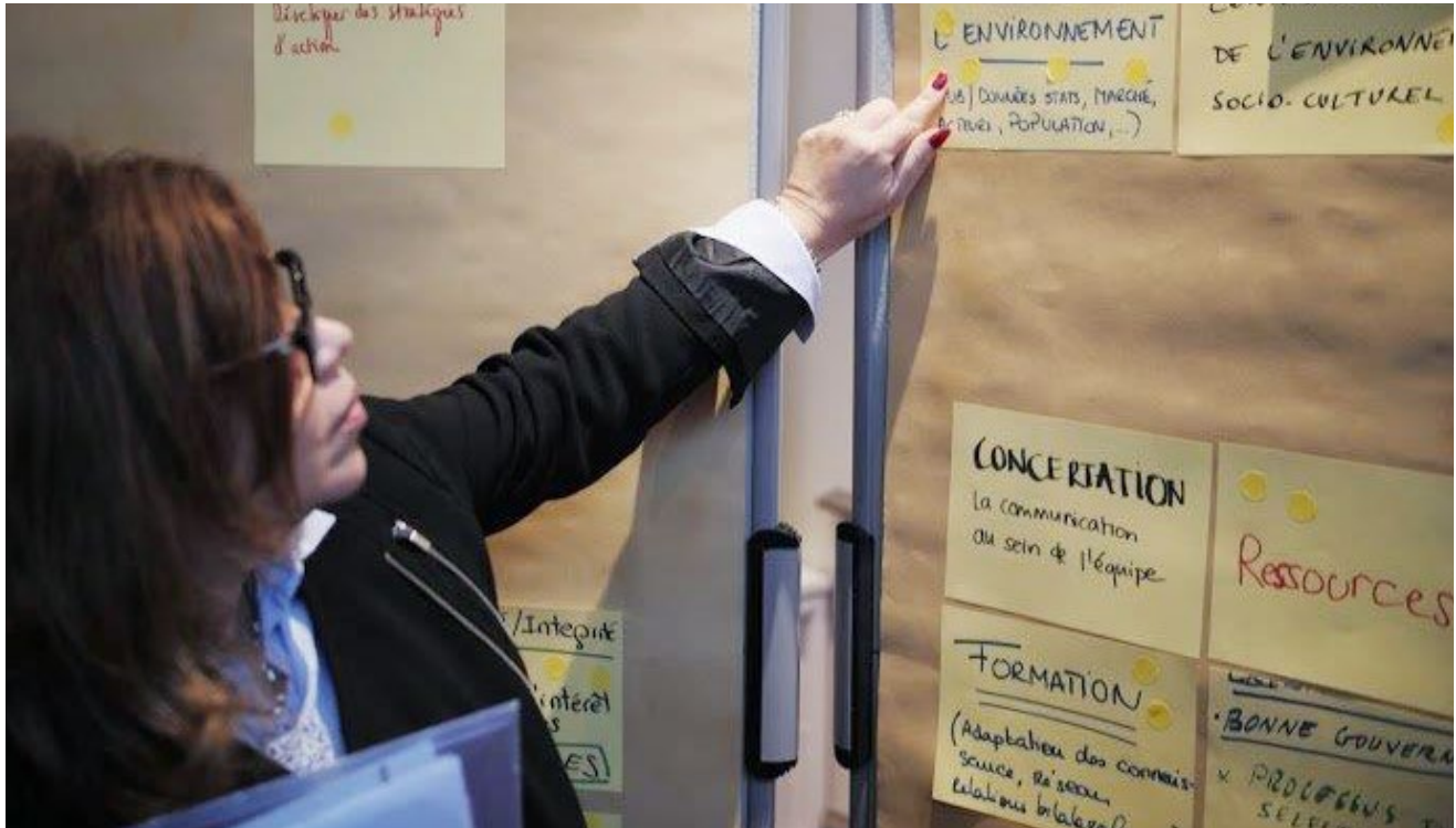
Réflexion collective sur l'avenir du REFRAM