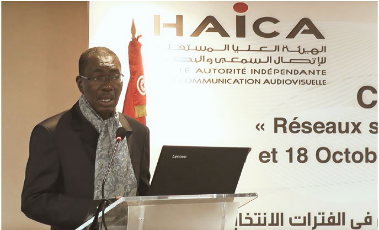
Conférence « Réseaux sociaux, régulation et processus électoraux », 17–18 octobre 2018, Tunis

Une seconde rencontre a été organisée à Tunis les 20 et 21 juin 2019. Placé sous le thème « Internet, réseaux sociaux et processus électoraux », ce séminaire s’est inscrit dans la lignée de la conférence d’octobre 2018. Il a constitué un espace de débats et d’échanges entre différents spécialistes et experts, cherchant à prolonger et approfondir la réflexion quant à l’impact des réseaux sociaux sur les élections. Au cours de ces travaux, les membres du REFRAM présents ont notamment échangé sur l’intégrité des processus électoraux, la lutte contre la désinformation en ligne, la vérification des faits et la possible influence d’états tiers dans le cadre d’une élection.