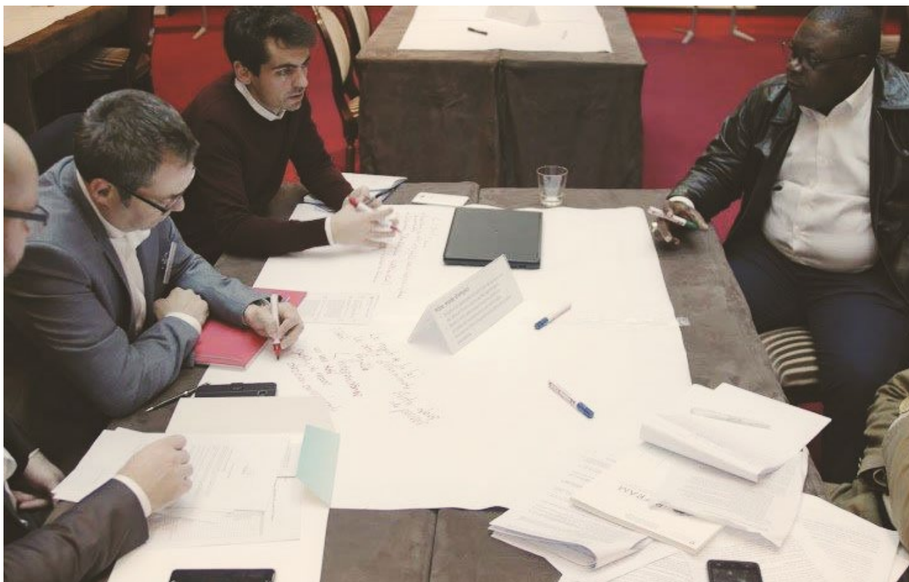
Lors de la 5e Conférence des Présidents, une session participative a été l'occasion de présenter le concept de revue par les pairs et de provoquer discussion et réflexion communes sur la possible adoption de la méthode par le Réseau.

Feuille de route 2018/2019 » Revue par les pairs » Guide pratique