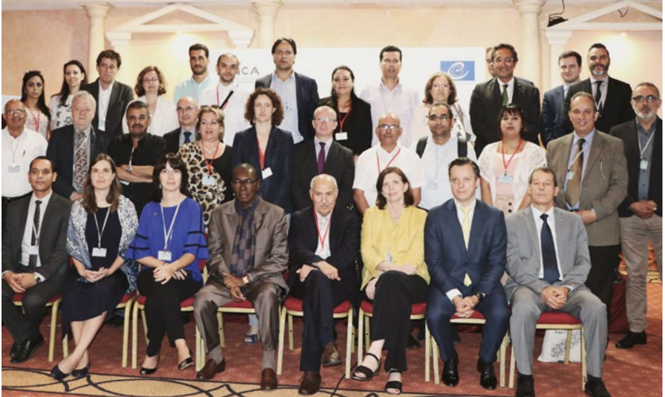
Séminaire « Internet, réseaux sociaux et processus électoraux », 20–21 juin 2019, Tunis

d'un site internet avec les impératifs de l'ensemble du périmètre du projet (aussi bien au plan fonctionnel qu'au niveau budgétaire).